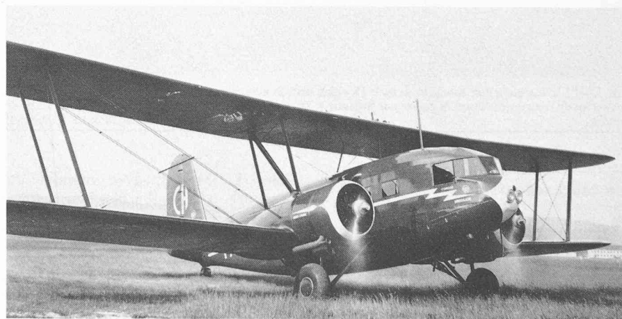
Fig. 2. — Un représentant de la génération d'avions rendus démodés par l'apparition du Boeing 247D et du DC-1: ce Curtiss-Wright Condor a fait partie de la flotte de Swissair en 1934.

Le Douglas DC-2 s'imposa d'emblée, dans le monde entier. Si l'on compare cet avion aux appareils européens contemporains, ces derniers font figure