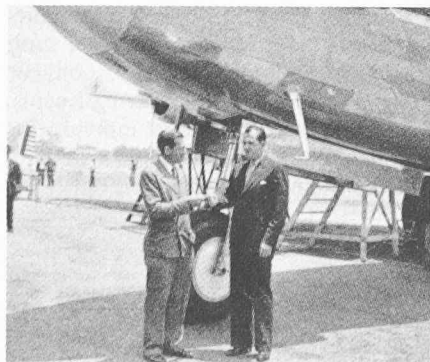
Fig. 4. — Donald Douglas (à gauche) devant le prototype du DC-4, qui a été l'un des premiers avions de transport équipé d'une roue de proue.

En 1938, 80% du trafic aérien des USA était assuré par des DC-3: les performances, la stabilité, la robustesse d'entretien, la rentabilité de ce type avaient conquis passagers, compagnies aériennes et techniciens. Si la carrière commerciale du DC-3 fut interrompue par la guerre, ce fut au bénéfice d'une carrière militaire: plus de 10 000 exemplaires en furent construits de 1939 à 1945. Là aussi, l'essentiel des transports aériens des Alliés furent le fait des diverses versions militaires du DC-3, allant du C-47 au C-53, avec des noms aussi célèbres que Dakota ou évocateurs que Skytrain ou Skytrooper .