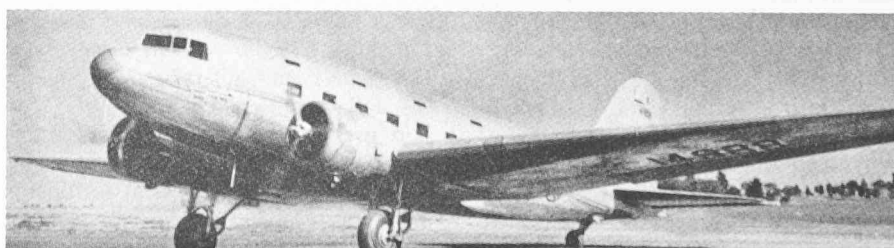
Fig. 3. — Premier d'une lignée de plus de 10 000 exemplaires (sans compter ceux construits en URSS), ce Douglas DST a effectué son premier vol le 18 décembre 1935 à Santa Monica (Californie).