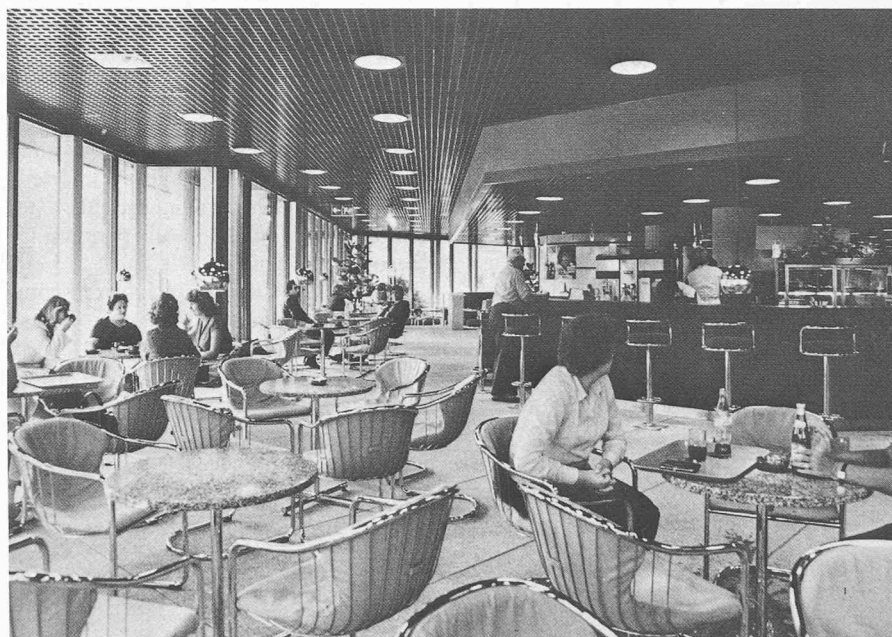
Cafétéria dans le restaurant du personnel.

nancement à long terme; elle a également participé à la construction et à l'aménagement du bâtiment en exécutant diverses commandes adjudgées à des maisons suisses.