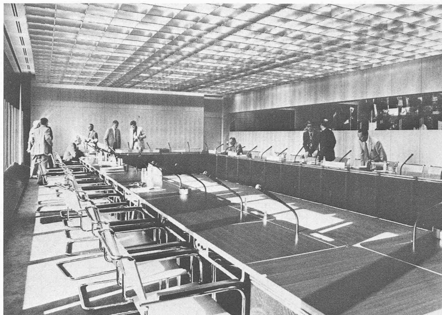
Petite salle de conférences.

Eu égard aux prévisions faites en ce qui concerne l'annonce des brevets, la Suisse participe par quelque 8% au fi-