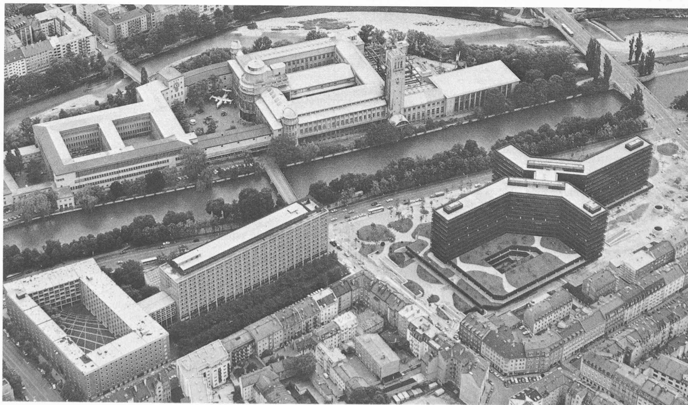
Vue aérienne, du nord. En haut, sur les rives de l'Isar, le Musée allemand; à gauche, l'Office allemand des brevets. A droite, le nouveau bâtiment administratif de l'Office européen des brevets.

Le projet du nouveau bâtiment administratif est le résultat d'un concours d'architecture international qui fut organisé dans les années 1970 à 1971. Les lauréats conçurent un corps de bâtiment très structuré et composé d'un bâtiment de 12 étages en forme de X reposant sur une construction basse de 1-2 étages, le tout situé sur la rive ouest de l'Isar, à proximité de l'Office allemand des brevets et du Musée allemand. Les espaces libres entourant le bâtiment donnent sur d'anciennes demeures voisines et