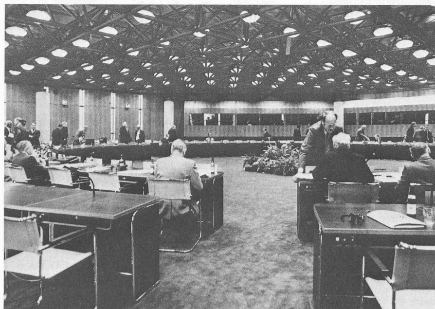
Grande salle de conférences.

dans la cour intérieure, le service de traitement des données, l'imprimerie et les ateliers. Les étages sont reliés entre eux par un escalier roulant situé dans le noyau du bâtiment et par plusieurs ascenseurs décentralisés ainsi que par un réseau de transport des dossiers. 26 salles de conférences au premier étage sont destinées aux séances de délibérations relatives aux recours et aux plaintes. La plupart d'entre elles sont équipées pour l'interprétation simultanée. La grande salle de conférences, qui peut contenir jusqu'à 450 personnes, est utilisée pour des séances des délégués des Etats membres ou affectée à des usages internes à l'Office, tels que cours, séances de travail, réunions du personnel. La petite salle de conférences de 40 à 50 places est prévue pour le même genre de manifestations. La plupart des 1500 collaborateurs travaillent dans les bureaux des 8 étages supérieurs. Le 5 e étage comprend un grand local fonctionnel pour les archives centrales.