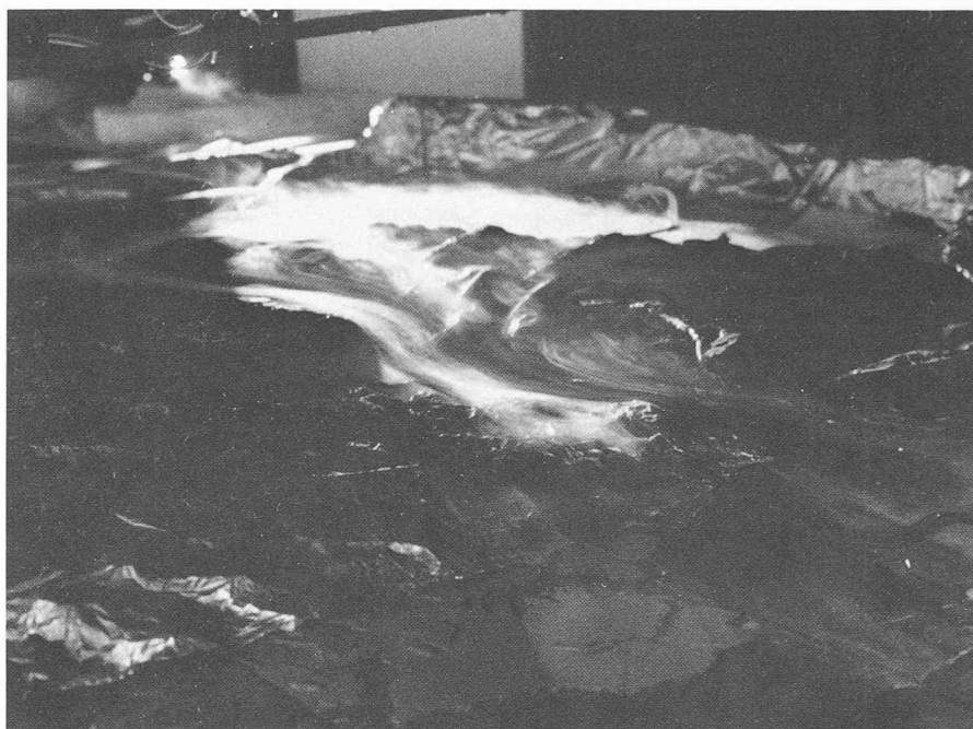
Fig. 8. — Lac d'air froid sur le Plateau suisse avec débordement par-dessus les crêtes du Jura, région Waldshut-Bâle vue du nord-ouest.

utilisée par l'Institut d'économie et d'aménagements énergétiques (IENER) de l'Ecole polytechnique fédérale de Lausanne (EPFL) sur un modèle tridimensionnel, à l'échelle 1/5000, de la région bâloise (vallée du Haut-Rhin) pour simuler des écoulements thermiques atmosphériques (voir figure 8). Ces travaux s'insèrent dans le cadre d'un projet plus vaste visant à déterminer l'impact