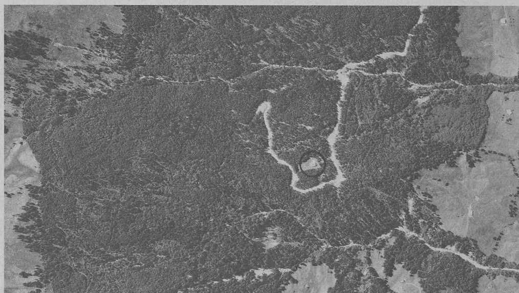
Développement d'un reboisement: reboisement «Glunggmoos», région du Lac Noir (FR).