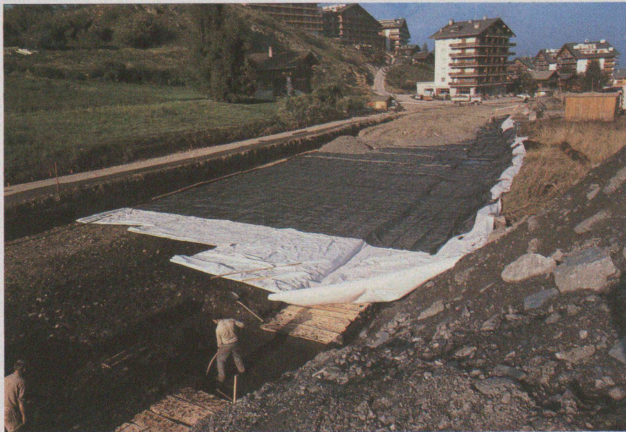
Fig. 13. — Vue d'ensemble du chantier.

bien que traversant une région de très mauvais sols, se maintient très bien, à tel point qu'il fut décidé la réalisation de l'aménagement sportif, adjaçant à la route, selon le même principe de construction.