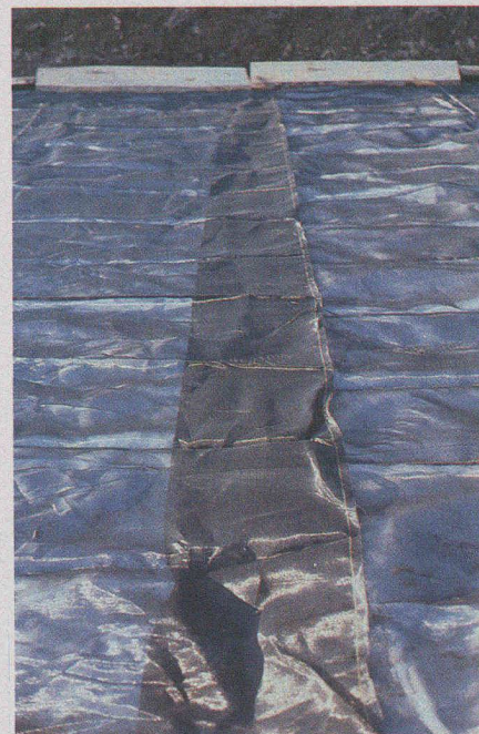
Fig. 14. — Recouvrement des laizes (tissé).

L'auteur remercie pour leur étroite collaboration