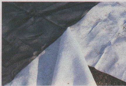
Fig. 11. — Tissé (noir) + nontissé (blanc).