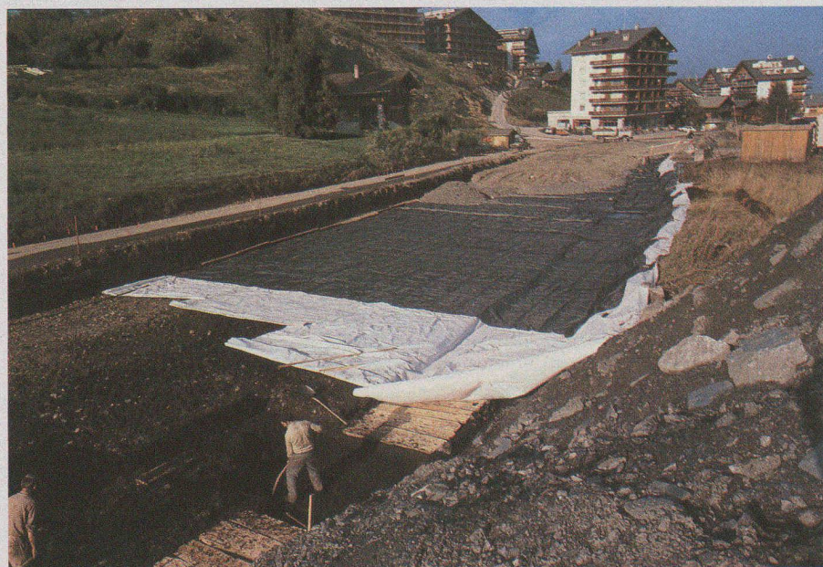
Fig. 13. — Vue d'ensemble du chantier.

bien que traversant une région de très mauvais sols, se maintient très bien, à tel point qu'il fut décidé la réalisation de l'aménagement sportif, adjaçant à la route, selon le même principe de construction.