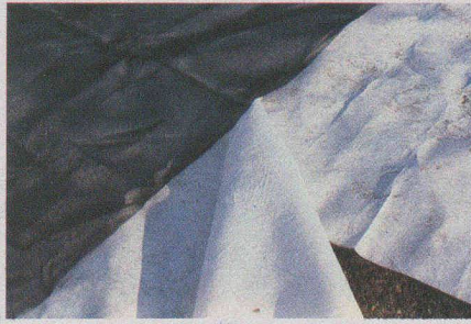
Fig. 11. — Tissé (noir) + nontissé (blanc).