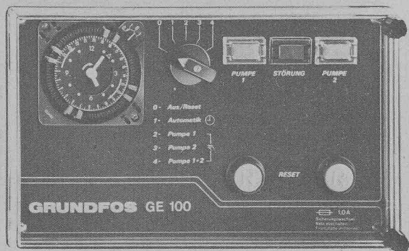
Programme complet d'éléments de tableau de commutation pour commande de vitesses de pompes individuelles et commande de commutation pour pompes doubles, ainsi que commande automatique de vitesses pour pompes doubles.

d'eau potable depuis une profondeur maximale de 600 m. Plus de 100 000 de ces pompes immergées, construites en série en acier chrome-nickel hygiénique, avec un débit allant jusqu'à 160 m 3 /h, fournissent actuellement un service de toute fiabilité. En tant que stations à haute pression, les pompes immergées Grundfos assurent la pression élevée nécessaire dans les installations de traitement d'eau, selon le principe de l'osmose inverse. Les pompes centrifuges verticales, à plusieurs étages, de la série CP/CR' couvrent le domaine des pompes industrielles. Dans ce cas également, le cœur de la pompe est en acier chrome-nickel. Grâce à ce matériau résistant à toute corrosion, la série CP/CR connaît — dans le domaine du débit allant jusqu'à 75 m 3 /h et de la hauteur manométrique allant jusqu'à 240 m — un vaste champ d'application, dont l'accent réside dans l'adduction d'eau et l'alimentation en eau.