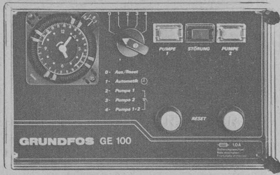
Programme complet d'éléments de tableau de commutation pour commande de vitesses de pompes individuelles et commande de commutation pour pompes doubles, ainsi que commande automatique de vitesses pour pompes doubles.

d'eau potable depuis une profondeur maximale de 600 m. Plus de 100 000 de ces pompes immergées, construites en série en acier chrome-nickel hygiénique, avec un débit allant jusqu'à 160 m 3 /h, fournissent actuellement un service de toute fiabilité. En tant que stations à haute pression, les pompes immergées Grundfos assurent la pression élevée nécessaire dans les installations de traitement d'eau, selon le principe de l'osmose inverse. Les pompes centrifuges verticales, à plusieurs étages, de la série CP/CR' couvrent le domaine des pompes industrielles. Dans ce cas également, le cœur de la pompe est en acier chrome-nickel. Grâce à ce matériau résistant à toute corrosion, la série CP/CR connaît — dans le domaine du débit allant jusqu'à 75 m 3 /h et de la hauteur manométrique allant jusqu'à 240 m — un vaste champ d'application, dont l'accent réside dans l'adduction d'eau et l'alimentation en eau.