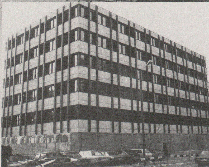
B761 Bâtiment administratif et commercial de Publicitas S.A., Lausanne. Ce chantier a été assuré par la VAUDOISE ASSURANCES.

Du projet à la réalité, nous «construisons» avec vous!