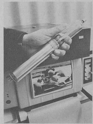
Ce tube est utilisé dans le nouveau récepteur de téléphotos TM 4006 de la société Dr.-Ing. Rudolf Hell GmbH. Le rayon laser reproduit la photo sur du papier « dry-silver » en rouleau. Un système automatique de développement thermique permet d'obtenir la photo définitive.

Les téléphotos transmises sur fil jusqu'au récepteur peuvent être modulées en fréquence (FM) ou en amplitude (AM). La transmission par radio se fait uniquement en modulation de fréquence. Quel que soit le procédé de modulation utilisé, la qualité de l'image dépend essentiellement de la modulabilité du récepteur. Il faut également que l'intégralité de la plage de luminosité soit restituée avec une parfaite graduation du noir au blanc, même lorsque les originaux sont mauvais. En mettant au point une géométrie spéciale de résonateur et en modifiant la pression de gaz, Siemens est parvenu à porter à 100 % la modulabilité des tubes laser, assez réduite jusqu'ici. Pour une puissance de sortie de 0,4 mW, le nouveau tube HeNe du type LGR 7625 a 298 mm de long et 36 mm de diamètre.