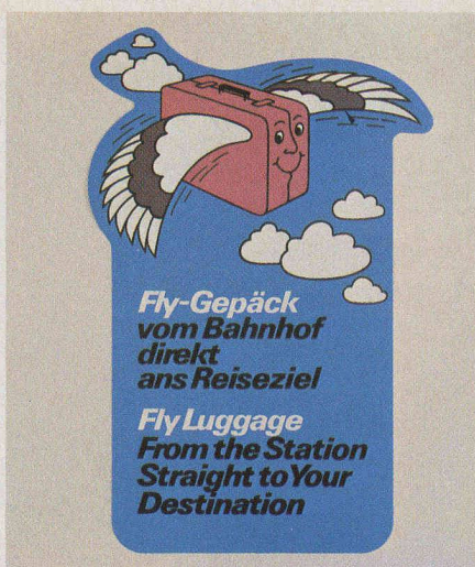
Fig. 2. — Valise volante et souriante pour les envois de bagages train-avion dans le monde entier.

La nouvelle prestation est appréciée de la clientèle, comme en témoignent les réactions très positives constatées lors de l'enregistrement. Les avantages sont évidents, car personne n'aime être encombré de valises durant le voyage. Il suffit souvent d'en informer la réception de l'hôtel. Le portier se charge alors des formalités d'expédition à la gare et le voyageur n'a plus à se soucier de ses bagages jusqu'à son arrivée à l'aéroport étranger, que ce soit Francfort ou Chicago, Hongkong ou Le Caire. Le voyage à destination de Zurich, les derniers achats en ville, le parcours jusqu'à