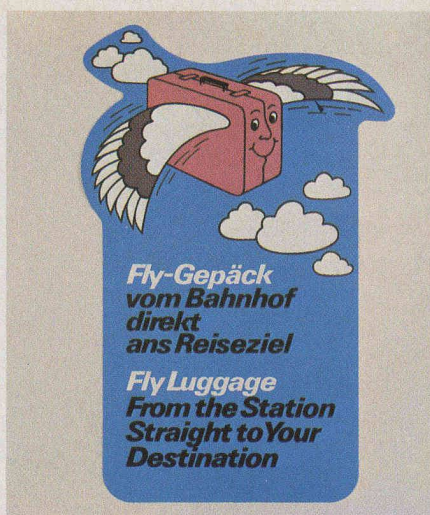
Fig. 2. — Valise volante et souriante pour les envois de bagages train-avion dans le monde entier.

La nouvelle prestation est appréciée de la clientèle, comme en témoignent les réactions très positives constatées lors de l'enregistrement. Les avantages sont évidents, car personne n'aime être encombré de valises durant le voyage. Il suffit souvent d'en informer la réception de l'hôtel. Le portier se charge alors des formalités d'expédition à la gare et le voyageur n'a plus à se soucier de ses bagages jusqu'à son arrivée à l'aéroport étranger, que ce soit Francfort ou Chicago, Hongkong ou Le Caire. Le voyage à destination de Zurich, les derniers achats en ville, le parcours jusqu'à