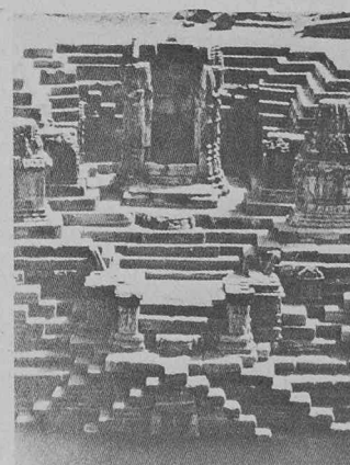
Temple et réservoir à Modhera (Inde).

Ces expositions sont organisées au département d'architecture de l'EPFL, avenue de l'Eglise-Anglaise 12, à Lausanne.