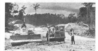
Photo du haut: Jeddah, Arabie Séoudite, 1976-78. Construction de la centrale thermique et de l'usine de dessalement de l'eau de mer.

Photo du bas: Voie Express du nord Abidjan-N'Douci, Côte d'Ivoire, 1975-81. Autoroute à 2x2 voies reliant Abidjan au nord du pays: Longueur des 1 re et 2 e étapes: env. 190 km.