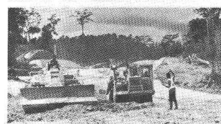
Photo du haut: Jeddah, Arabie Séoudite, 1976-78. Construction de la centrale thermique et de l'usine de dessalement de l'eau de mer.

Photo du bas: Voie Express du nord Abidjan-N'Douci, Côte d'Ivoire, 1975-81. Autoroute à 2x2 voies reliant Abidjan au nord du pays: Longueur des 1 re et 2 e étapes: env. 190 km.