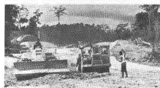
Photo du bas: Voie Express du nord Abidjan-N'Douci, Côte d'Ivoire, 1975-81. Autoroute à 2x2 voies reliant Abidjan au nord du pays: Longueur des 1 re et 2 e étapes: env. 190 km.

Ces ouvrages ont été réalisés en association avec une ou plusieurs entreprises.