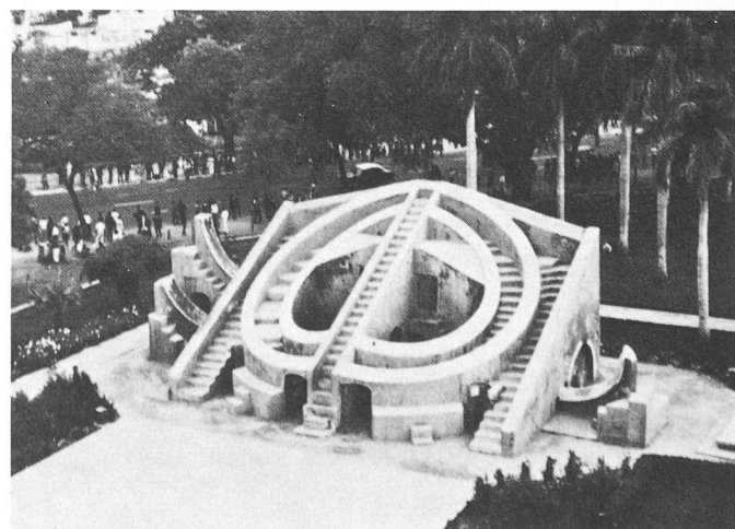
Instrument astronomique Misra Yantra, New Delhi (Inde).