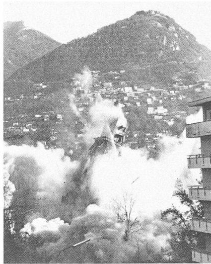
Fig. 6. — Dernière phase.