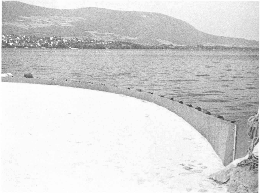
Fig. 6. — Il est parfois nécessaire de placer le barrage à l'embouchure d'une rivière dans un lac, lorsque le courant est trop important pour stopper la pollution en amont.

En cas d'interventions sur les lacs, la Société internationale de sauvetage du Léman a communiqué à l'Office de la protection des eaux la liste des bateaux que chacune de ses sections peut mettre à disposition sur simple appel téléphonique.