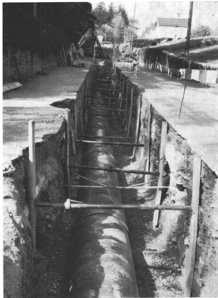
Commune d'Echichens sur Morges Collecteur d'eaux de surface \varnothing 90 cm

Tuyaux et pièces en polyester stratifié avec fibres de verre ARMAVERON