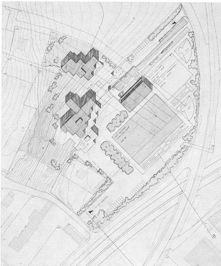
Plan de situation. Echelle 1 : 2500.