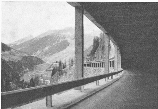
Fig. 31 — Galerie du versant italien.

qui était indispensable pour l'approche du matériel pendant les travaux de montage du générateur de vapeur ; elles facilitent également le service de surveillance puisqu'il est possible d'accéder aux installations de traitement d'eau d'appoint, à la salle des compresseurs et à la station de pompage du parc de stockage de combustible, sans avoir à sortir de locaux abrités.