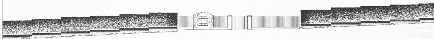
Entrée sur rue. — Echelle 1 : 1200.