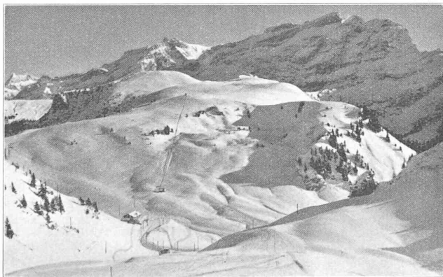
Bretaye. — Le « Télé-skis ». Au fond : Les Diablerets.

L'application des funiculaires à traîneaux comme moyen de transport pour skieurs prend une extension de plus en plus considérable dans nos montagnes suisses. Ces funiculaires, communément appelés « télé-luges » permettent le transport d'un nombre élevé de personnes sans avoir toutefois à recourir à des constructions d'un prix très élevé. En effet, la piste est établie directement dans la neige et n'a besoin que d'un entretien minimum pour autant que les chutes de neige favorisent la contrée à desservir. Cette dernière condition est évidemment largement remplie dans le cas du télé-luges établi, cette année, entre Bretaye et le Chamossaire. En effet, l'altitude de la station supérieure se trouve à 2097 m, tandis que la station de départ a un niveau de 1811 m. La différence d'altitude des stations est donc de 286 m, la longueur du trajet étant de 1058 m. Les deux traîneaux ayant une capacité de 20 personnes chacun, sont reliés entre eux par un câble passant sur les poulies de renvoi de la station supérieure tandis que le mécanisme de commande se trouve à la station inférieure actionnant le contre-câble