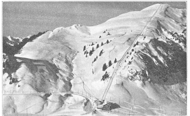
Le Chamossaire avec son « Funi-skis ».

Le télé-luges présente l'avantage sur le télé-skis de permettre la descente des non-skieurs. Il est ainsi possible, actuellement, pour un amateur de belle vue, de monter au sommet du Chamossaire tout en restant confortablement assis d'abord dans le train, puis dans le traîneau et sans avoir, au retour, à effectuer en skis une descente vertigineuse, perspective qui souvent empêche les skieurs de moindre classe ou les débutants de se lancer à de pareilles altitudes.