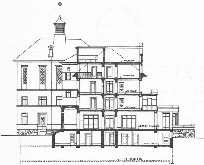
Preventorium « Le Rosaire ». Coupe transversale 1 : 400.

tion duquel est placé cet établissement — est le modèle d'un preventorium répondant aux exigences de l'hygiène la plus difficile et d'un confort discret, sans luxe inutile. »