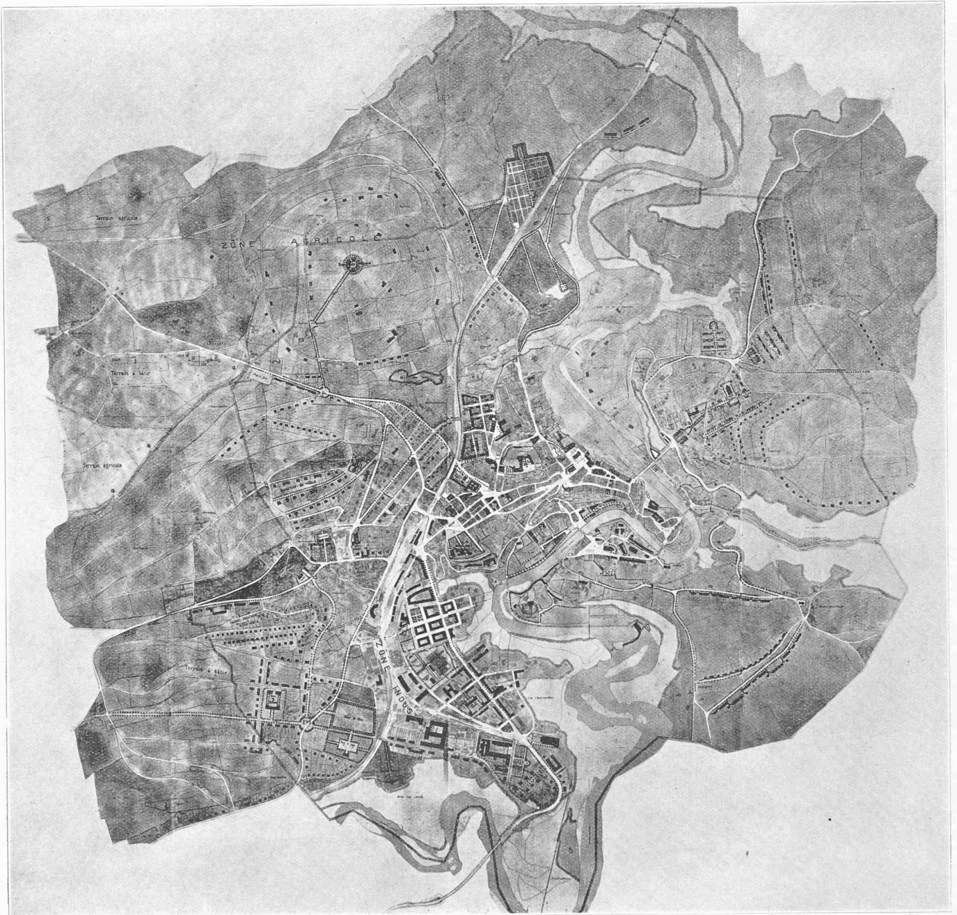
II e prix : projet « Par monts et par vaux », de MM. Hertling et Job , architectes et Villard , géomètre.

supprimer cette communication est inadmissible. Les circonstances défavorables qui résultent des conditions du chemin de fer ne doivent pas être aggravées, mais améliorées.