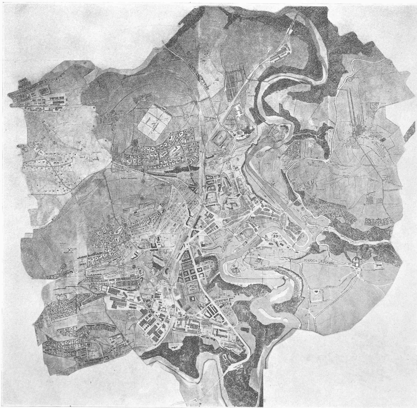
1 er prix : projet « Science et industrie », de MM. Cuony , architecte, Tercier , géomètre et Hefti , ingénieur.

eux se soient limités à une multiplication de villas, sans étudier parallèlement le développement urbain. C'est une erreur de ne prévoir qu'une cité-jardin. C'est plutôt le développement qui permet d'augmenter le nombre des habitations isolées. Le quartier de Beauregard, en particulier, est susceptible d'un plus grand développement urbain.