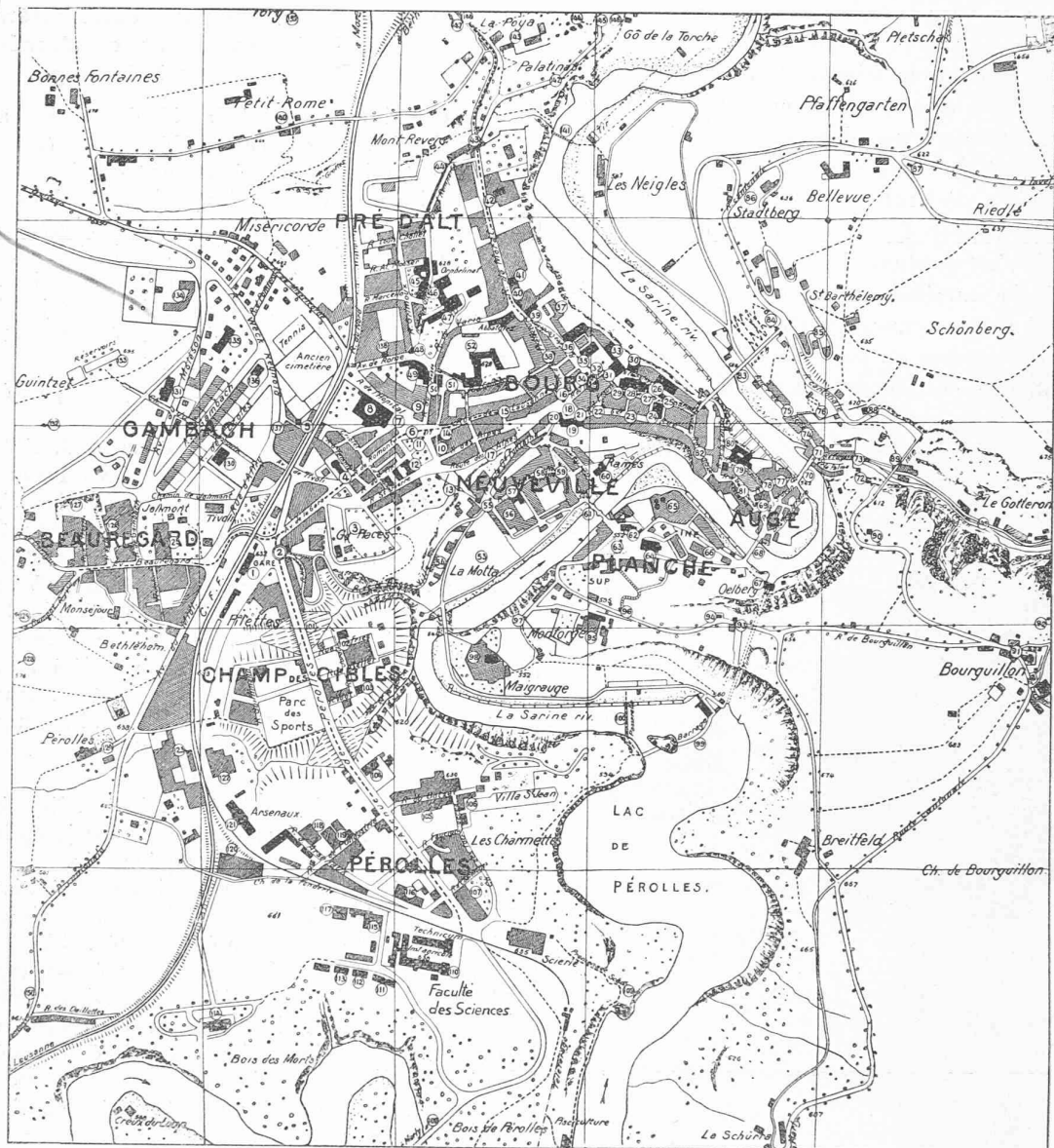
Plan schématique de Fribourg, élaboré par M. L. Stucky, géomètre, à Fribourg.

Légende : 6 = Place St-Pierre. — 8 = Hôpital des Bourgeois. — 12 = Hôtel des Postes. — 16 = Le Tilleul. — 19 = Hôtel Cantonal. — 21 = Hôtel de Ville. — 28 = Cathédrale. — 33 = Grenette. — 40 = Conservatoire de musique. — 50 = Université (Lycée) — 52 = Collège St-Michel. — 68 = Pont des Tisserands. — 70 = Pont de Berne. — 83 = Pont de Zähringen. — 109 = Pont de Péroilles. — 113 = Maternité. — 114 = Hospice des Vieillards. — 116 = Moulins de Péroilles. — 122 = Fabrique d'engrais chimiques. — 128 = La Vignettaz. — 129 = Hôpital Daler. — 131 = Hôpital Cantonal. — 139 = Colline de Tory. — 143 = La Poya. — La route de Payerne est le prolongement, vers l'ouest, de l'avenue Weck-Reynold.