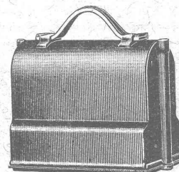
Niveau emballé, \frac{1}{6} grandeur naturelle

S. A. de Vente H. Wild - Heerbrugg Téléphone 95 (St-Gall)