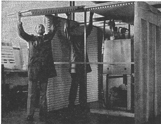
Montage d'une cabine anti-bruit

Les nuisances du bruit se font remarquer dans tous les domaines. Le bruit trop excessif présente un grand danger pour notre environnement.