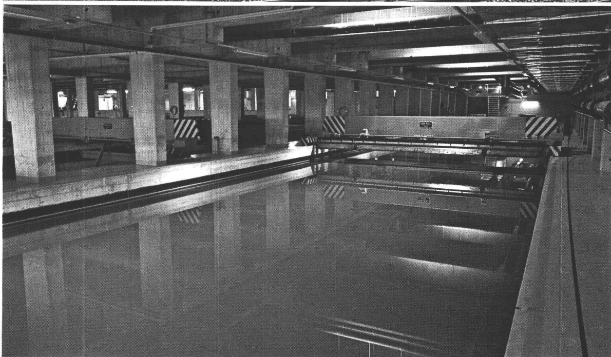
Station d'épuration des eaux à Vevey