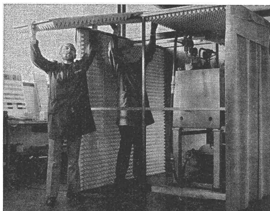
Montage d'une cabine antibruit

Les nuisances du bruit se font remarquer dans tous les domaines. Le bruit trop excessif présente un grand danger pour notre environnement.