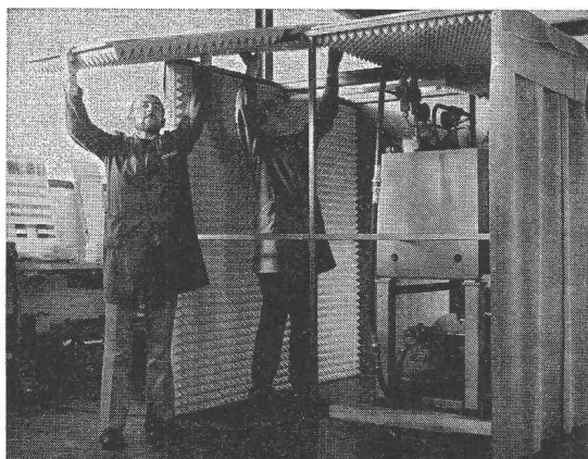
Montage d'une cabine antibruit

Les nuisances du bruit se font remarquer dans tous les domaines. Le bruit trop excessif présente un grand danger pour notre environnement.