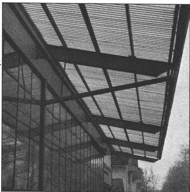
CREATIVE-TEAM - 4f

Nos plaques translucides sont non-corrosifs, ils résistent aux intempéries et sont tenaces aux chocs.