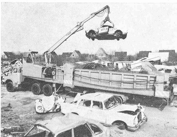
Le nouvel autocracker Krupp.