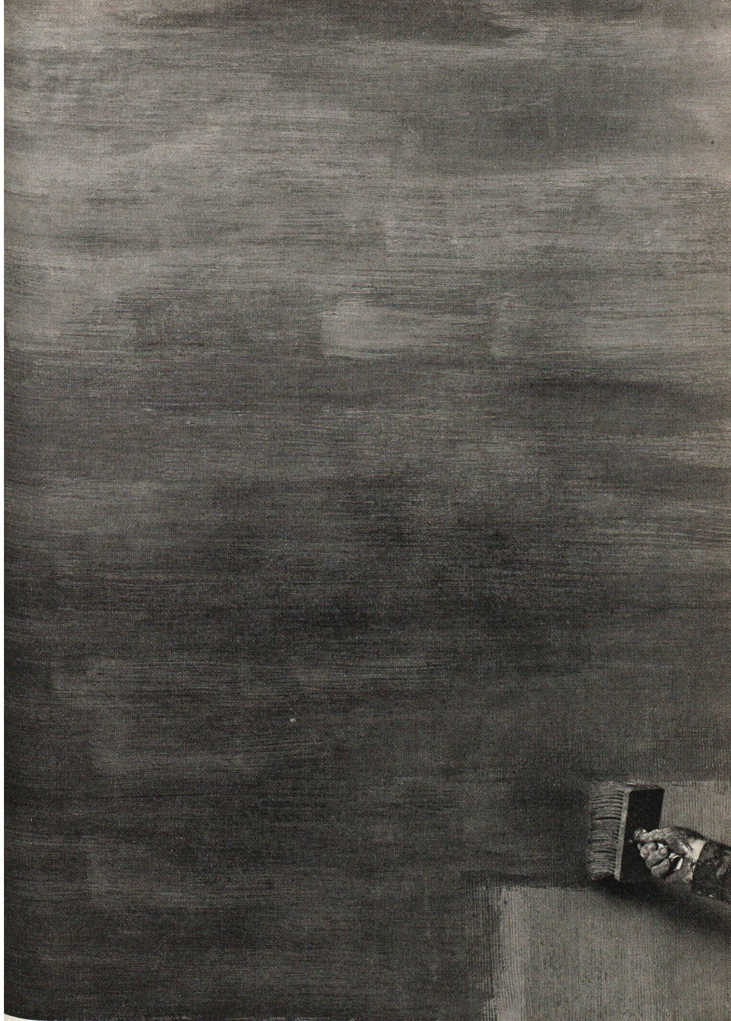
Voici un mur de béton. Derrière, il y a de l'eau. Beaucoup d'eau. Mais cette eau ne passera pas. Parce qu'elle a affaire à forte partie, l'étanchement durable Barra Enduit. Un produit de Meynadier.