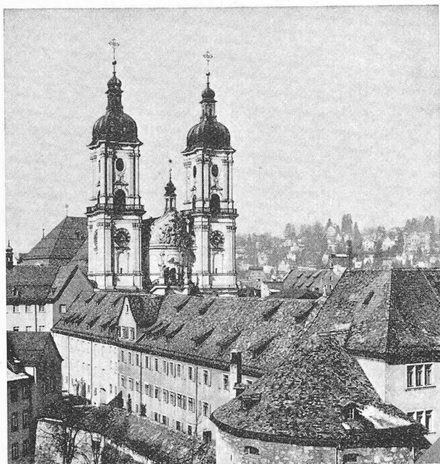
Tours de la collégiale de Saint-Gall. Au 1 er plan, un corps de bâtiment de l'ancien couvent avec des restes de fortifications et la dernière tour de défense.

grâce à son intéressante structure architecturale que maintes villes plus grandes lui envient. Après un apéritif offert par la ville de Saint-Gall, tout le monde s'installa dans la grande salle de spectacle où l'on joue d'habitude des opéras, opérettes et pièces de théâtre. Cette fois, on entendit tout d'abord une allocution de notre président, M. A. Cogliatti, qui exposa de manière claire et impressionnante les problèmes marquant la marche de la Société orientée par les nouveaux statuts. Cette revue générale, comportant des éléments dont certains membres n'avaient peut-être jusqu'ici pas clairement mesuré la portée, fut certainement utile pour tous 1 .