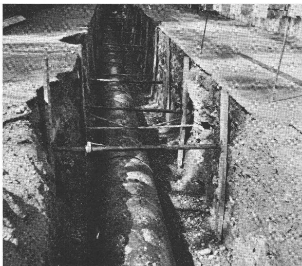
Collecteur \varnothing 90 cm à Echichens VD

tuyaux en polyester stratifié avec fibres de verre \varnothing 40-150 cm