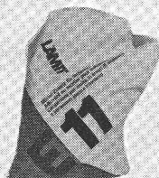
LAMIT E 11 Additif au mortier pour maçonnerie de parement

L'addition de LAMIT E 10 au mortier bâtard ou de ciment pur en améliore l'ouvrabilité et facilite le maçonnerage. Comme le mélange devient plus ferme, les pertes de mortier sont plus petites. Les conditions de prise sont plus favorables et l'adhérence entre brique et mortier est plus forte.