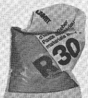
LAMIT R 30 Colle pour matières isolantes

Ajouté au mortier de ciment pur, le LAMIT E 11 permet la construction de maçonnerie de parement à joints étanches. Le jointoiement supplémentaire jusqu'à présent nécessaire en une seconde opération est supprimé. Cet additif au mortier simplifie la construction de maçonnerie de parement de haute qualité.