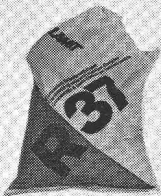
LAMIT R 37 Concentré de colle pour matières isolantes

LAMIT R 30 est une colle à pouvoir adhésif optimal. Il permet le collage économique à pleine surface de panneaux isolants légers (laine minérale, plastiques cellulaires, liège, fibres de bois liées par ciment ou magnésite) sur murs et plafonds. Le fond n'a pas besoin d'être humecté et un étagage est superflu.