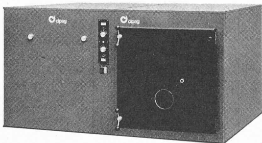
Fig. 2. — Chaudière combinée CIPAG CH à haute puissance avec chauffe-eau latéral.

Les nouvelles chaudières CIPAG CH à haute puissance, de 200 000 à 1 250 000 kcal/h, avec et sans producteur d'eau chaude, superposé ou adjacent, équipée d'un récupérateur original constitué par 2 à 6 gros tubes de fumée munis intérieurement d'éléments capteurs de chaleur en cuivre (brevet déposé), d'où construction ramassée (gains de place et de poids).