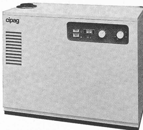
Fig. 3. — Chaudière combinée à gaz CIPAG CSG 20/100.

Les nouvelles chaudières combinées à gaz CIPAG CSG de 20 000 et 35 000 kcal/h, munies d'un brûleur atmosphérique multigaz, et connues pour leur exploitation particulièrement économique grâce à une conception originale.