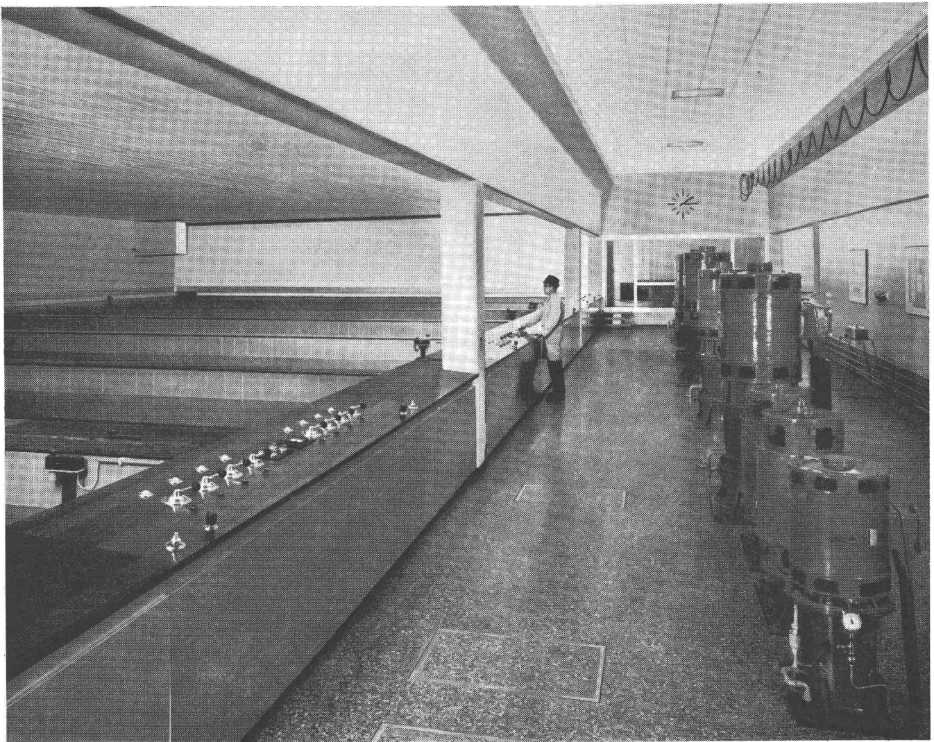
Station de filtres rapides «Champ-Bougin» de la ville de Neuchâtel ayant un débit de 1800 m 3 /h. A droite, les moteurs d'entraînement des pompes