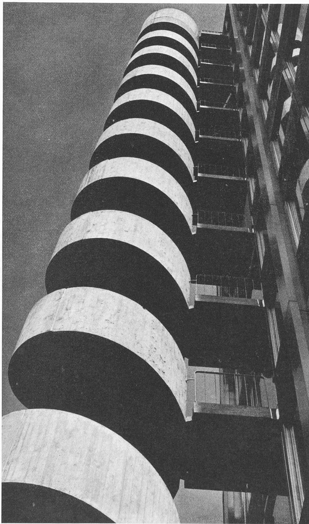
L'escalier de secours sur la façade nord-ouest de la maison SIA