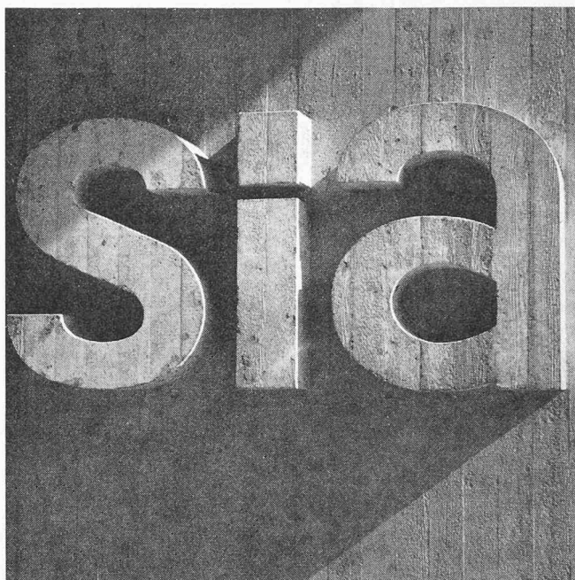
Ce sigle vous accueillera à l'entrée de la maison SIA.

Ce groupe a organisé, en collaboration avec l'Association suisse de fabricants d'objets en matière plastique un séminaire sur les matières plastiques et notamment sur l'emploi