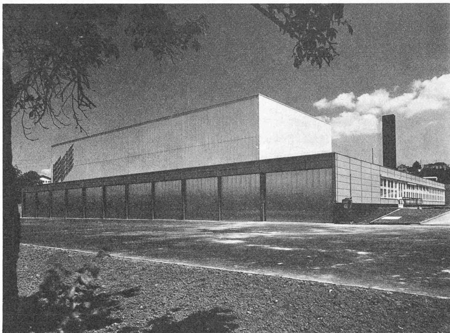
Fig. 1. — Vue générale.

Il faut éviter aussi que la machine ne dépasse les gabarits d'exploitation (par exemple, le dernier casier). Pour cela, un dispositif spécial doit permettre la surveillance ininterrompue de toutes les informations et de tous les circuits. Dès la constatation d'une erreur, on doit éviter que le gerbeur ne heurte les butoirs. Si, par exemple, l'interrupteur principal du moteur d'entraînement ne fonctionne plus, le courant n'est pas coupé au signal de freinage. Il faut donc un dispositif de sécurité qui empêchera la machine d'atteindre la butée d'arrêt à la vitesse de 2,5 m/s pour un poids de 10 t. On évite ce danger en disposant des sécurités supplémentaires aux extrémités des couloirs pour déclencher le freinage d'urgence.