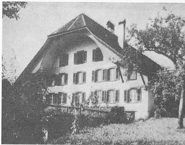
1. Maison de paysan cossue dans la campagne bernoise La façade et le sous-toit sont revêtus d'ardoises en amiantociment « ETERNIT » en double recouvrement.

Les maisons en bois massif, rond ou équarri, n'ont généralement pas de revêtement extérieur. Le climat plutôt rude de notre pays et aussi le danger d'incendie dans les régions soumises au fœhn rendent une protection extérieure indispensable tant en ce qui concerne les constructions en treillis