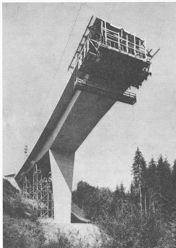
Fig. 36 — Autoroute Lausanne-Saint-Maurice. Pont sur la Sorge.

Il est donc très souhaitable que l'architecte soit consulté dès le début de l'étude. En effet, sans que le coût d'un ouvrage soit nécessairement augmenté ou que les critères techniques déterminants pour le choix en soient modifiés, il peut souvent améliorer sensiblement l'esthétique et intégrer la construction dans son cadre naturel.