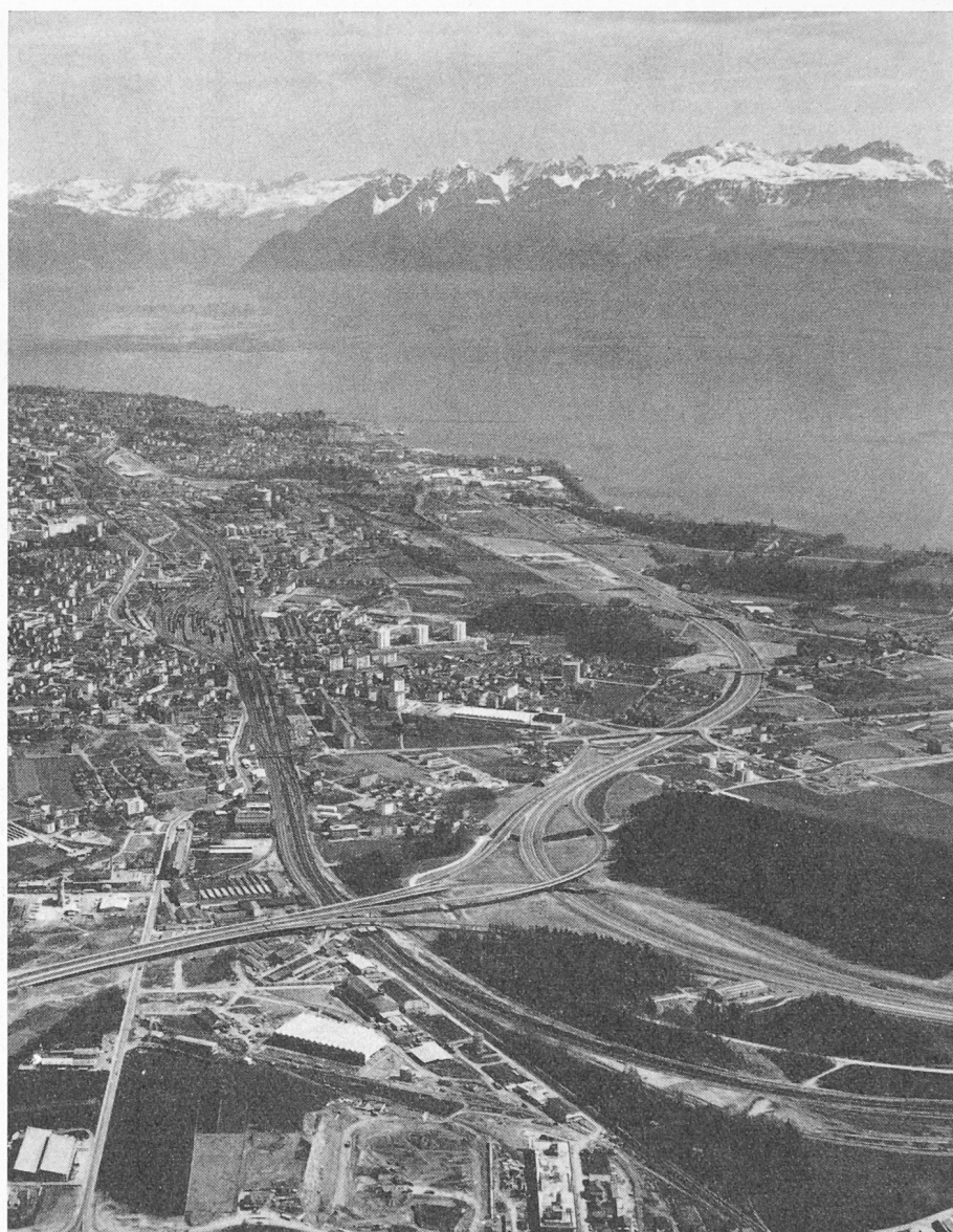
Fig. 33 — Autoroute Genève-Lausanne-Berne. Echangeur de circulation d'Ecublens. Vue aérienne.

Le constructeur de ponts est tributaire pour l'élaboration de son projet, de nombreux facteurs, qui souvent lui imposent la solution sur le plan technique.