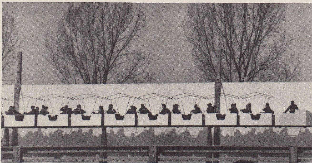
Fig. 2. — Une vue des wagonnets du monorail.

de transport en commun non seulement attractifs mais rationnels, puisqu'ils n'occupent respectivement qu'une surface utile par voyageur transporté de 0,7 et 1,5 m 2 . A ce dernier titre, seuls les chemins de fer à très grande capacité peuvent rivaliser avec eux.