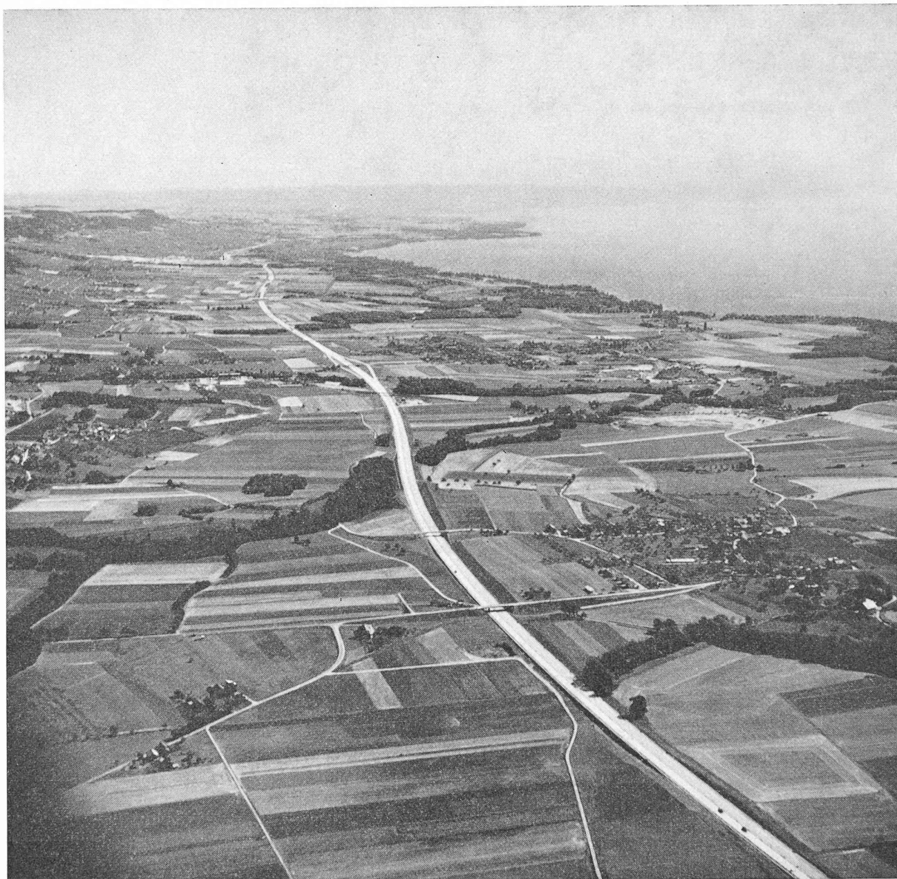
Fig. 1. — Tronçon de l'autoroute dans la région de Nyon-Gland.

le problème essentiel est de quelle manière on compactera les remblais. Dans la plupart des cas, c'est la teneur en eau du matériel à remblayer qui est déterminante pour le compactage. Les périodes de pluie obligent l'entrepreneur à suspendre les travaux de terrassement. Après une pluie, il faut laisser sécher les terrains, ce qui demande en général une semaine. A part les terrains graveleux, presque tous les sols sont sensibles à la teneur en eau pour la formation des remblais et pour le compactage ; en Suisse, ils dépassent souvent l'humidité de l'optimum de Proctor. L'entrepreneur est obligé de tenir à sa disposition un petit laboratoire géotechnique pour contrôler les caractéristiques des divers matériaux et pour déterminer le genre de machine le mieux approprié aux compactages.