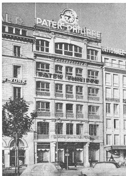
Fig. 1. — L'immeuble plus que centenaire de l'entreprise, 22, quai Général-Guisan.

Son effectif d'environ 240 personnes se compose principalement de techniciens, d'horlogers spécialisés