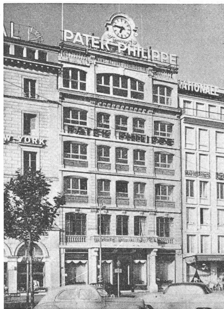
Fig. 1. — L'immeuble plus que centenaire de l'entreprise, 22, quai Général-Guisan.

Son effectif d'environ 240 personnes se compose principalement de techniciens, d'horlogers spécialisés