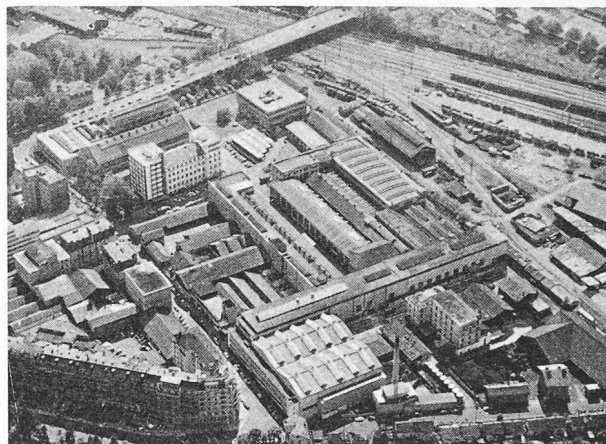
Fig. 1. — Vue d'ensemble de la S.A. des Ateliers de Sécheron.

La raison sociale, qui s'était transformée en 1887 en Cuénod, Sautter & C ie , fut modifiée une nouvelle fois en 1891, lorsque l'entreprise fusionna avec la Société d'Appareillage Electrique (SAE), pour devenir la Compagnie de l'Industrie Electrique (CIE). La SAE, de son côté, avait consacré les premières années de son activité au développement des installations d'éclairage et à la vente de lampes à incandescence inventées par Thomas Alva Edison, avec qui un contrat de licence avait été signé en 1883. La collaboration entre les deux partenaires de la CIE s'était amorcée en 1886/87, lors de la mise en service de l'usine hydro-électrique du Pont de la Machine, sur le Rhône, pour laquelle la SAE avait commandé trois groupes de 200 ch à la maison A. de Meuron & Cuénod.