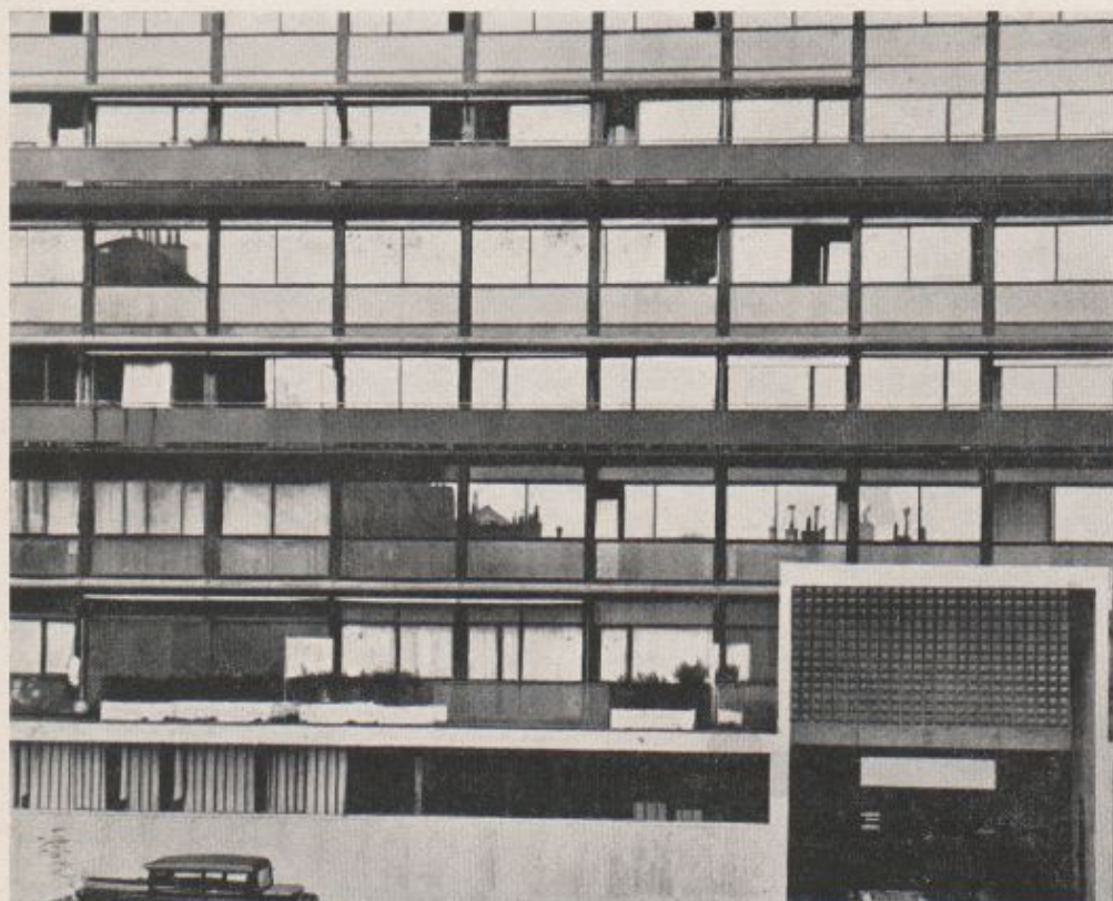
La maison « Clarté » de Le Corbusier, 1930

Ni la conception, ni la construction du mur-rideau ne se sont fondamentalement modifiées depuis trente ans.