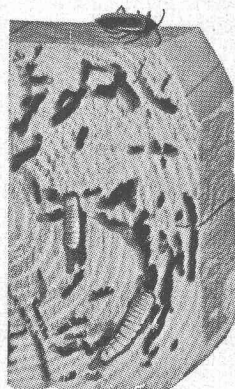
Pièce de charpente rongée par les larves d'hylotrupe