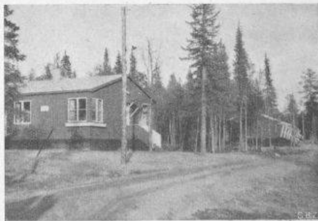
Fig. 10. — Cité ouvrière au nord du Carole polaire.