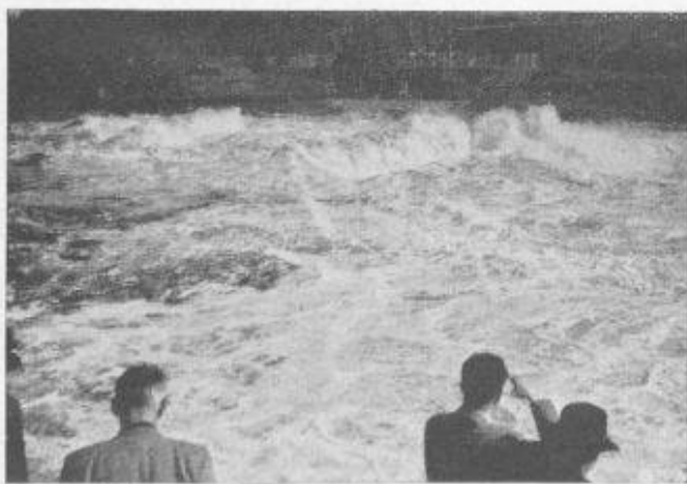
Fig. 8. — Nämforsen.

A la suite du Congrès de Stockholm, un voyage d'études de plusieurs jours avait été organisé par le Comité suédois pour permettre aux visiteurs d'avoir une vue d'ensemble de la conception des installations hydro-électriques en Suède. Cette prise de contact fut précieuse d'autant plus que les publications dans ce domaine sont rares et relativement