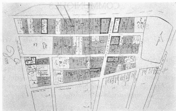
Fig. 22. — Saint-Prex. Plan de la 2 e moitié du XVII e siècle. (Archives cantonales).

y sont certainement insuffisantes. Les habitations, en majeure partie bâties en ordre contigu, sont souvent encore du type rural : rez-de-chaussée abritant la cave, autrefois le pressoir, une remise ; étages supérieurs servant au logement.