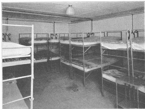
Fig. 5. — Salle pour l'oxygénothérapie.

de pansement et d'opération est en carrelage grès ; les parois et le plafond sont traités au ripolin blanc ; les lavabos sont fixés sur une plaque d'éternit poli. (Fig. 4.).