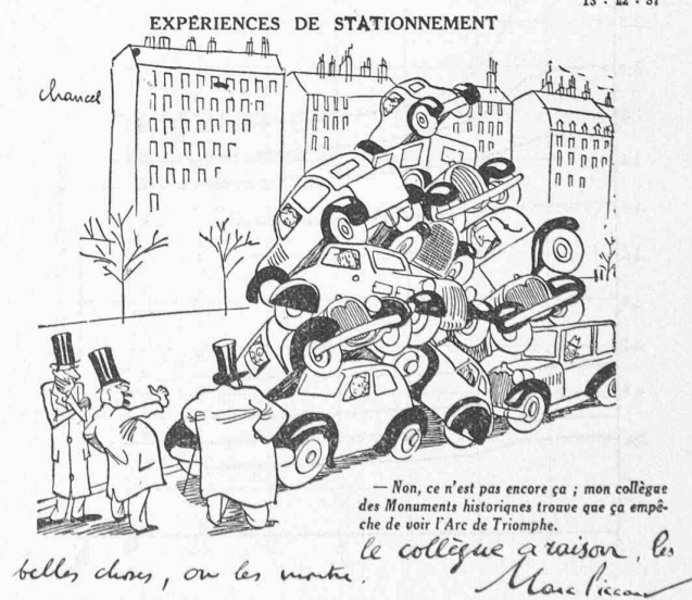
Fig. 2. — Coupure de journal.

Il faut une base, sans doute, mais la meilleure base n'est-elle