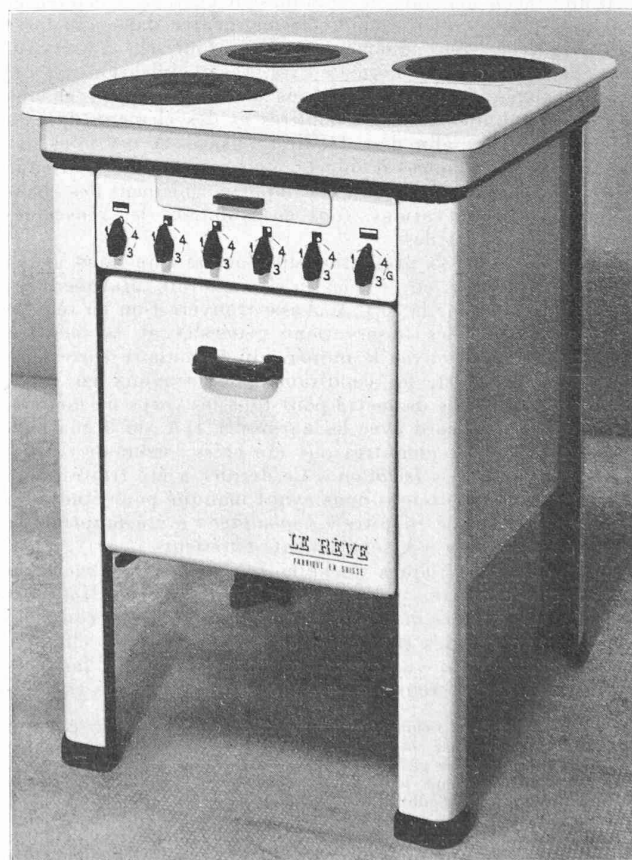
Cuisinière électrique « Le Rêve » (Genève). (« Anneaux chauffants » brevetés).

Signalons enfin une nouvelle application de l'énergie électrique appelée à rendre service dans notre pays où les variations de température sont en général assez brusques ; c'est le chauffage des couches et des serres. Une couche de démonstration avec câble chauffant, exposée au stand de l'OFEL, a remporté un vif succès auprès des horticulteurs.